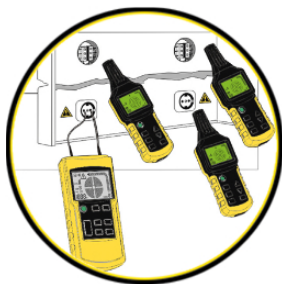
Localización y seguimiento de líneas y tomas