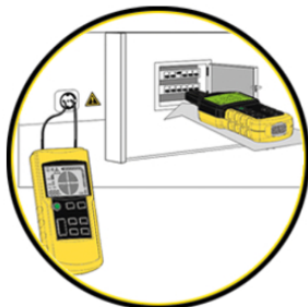
Búsqueda de fusibles