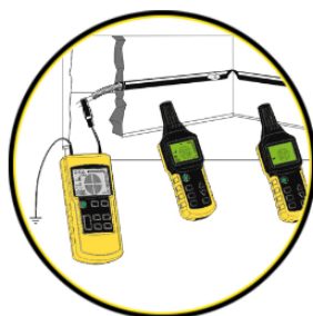
Detección de la zona obstruida de un tubo no metálico