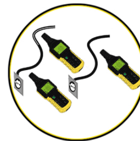
Identificación de la tensión de red y búsqueda de corte en el circuito