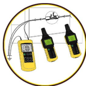
Localización de las interrupciones de líneas