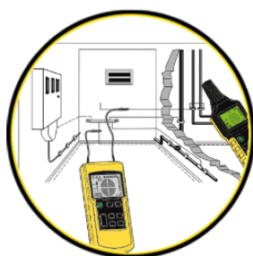
Detección de un tubo metálico de suministro de agua