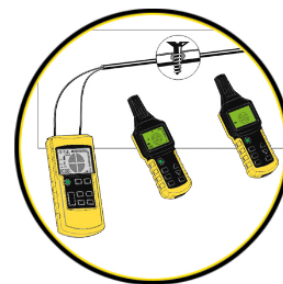
Búsqueda de cortocircuito