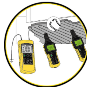
Detección de defectos de un sistema de suelo radiante