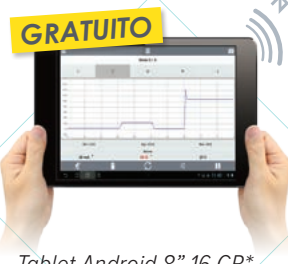
Tablet Android 8" 16 GB*