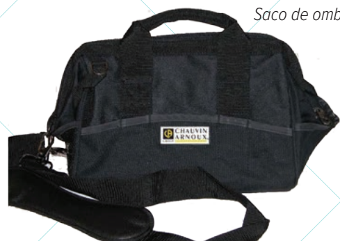
Saco de ombro